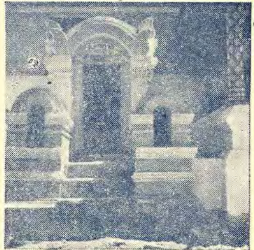
หอสุทวาราย