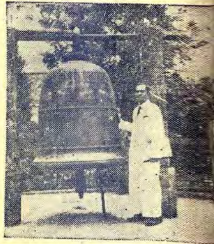
ระฆังใหญ่