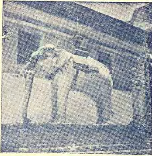
ช้าง ข้างเผือก