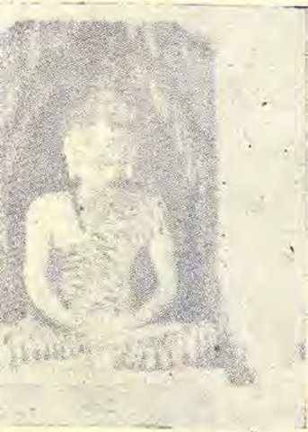
สุทวาราย