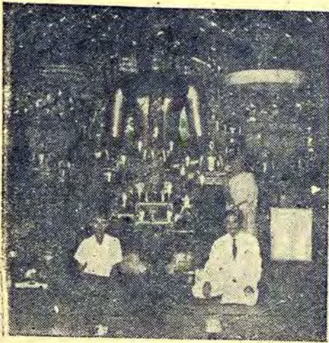
พระประธานในวิหาร